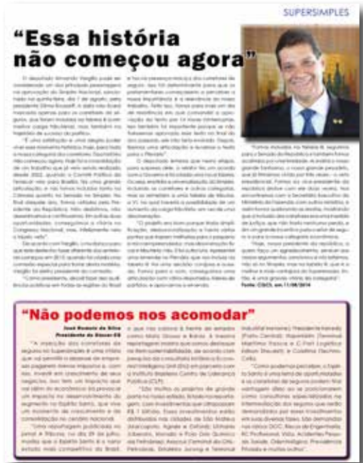
Páginas da Revista Sincor-ES de agosto de 2014, destacando a inclusão dos Corretores de Seguros no Supersimples.